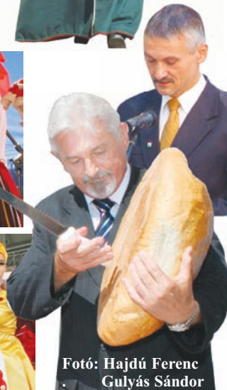
Fotó: Hajdú Ferenc Gulyás Sándor