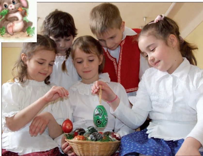
Nyakunkon a Húsvét. Lázasan folynak az előkészületek a Dózsa György Utcai Óvodában is. A gyermekek szebbnél-szebb himes tojásokat festettek a locsolkodók örömeire.