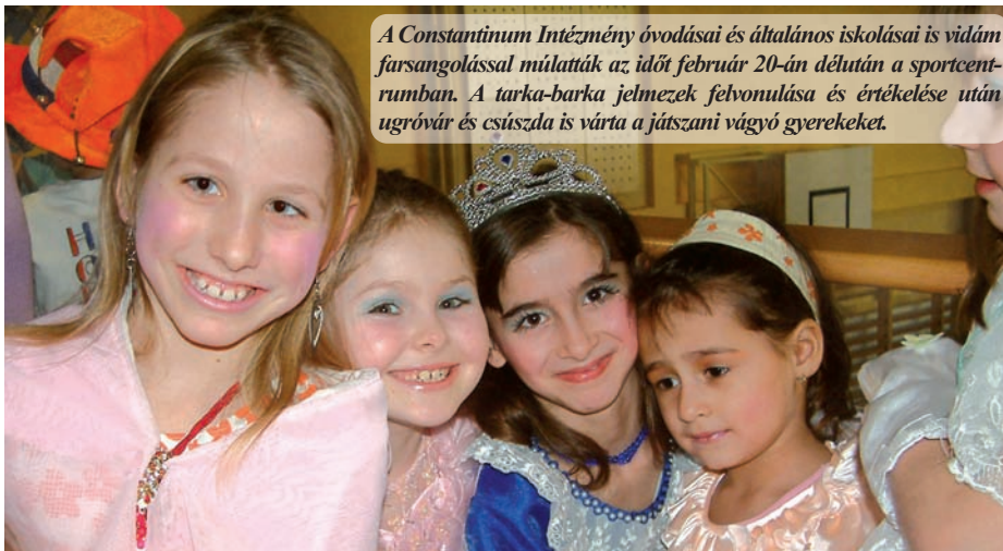
A Constantinum Intézmény óvodásai és általános iskolásai is vidám farsangolással múltatták az időt február 20-án délután a sportcentrumban. A tarka-barka jelmezek felvonulása és értékelése után ugróvár és esúszda is várta a játszani vágyó gyerekeket.