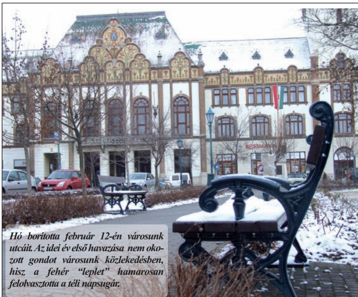
Hó borította február 12-én városunk utcáit. Az idei év első havazása nem okozott gondot városunk közlekedésében, hisz a fehér "leplet" hamarosan felolvastotta a téli napsugár.

A pályán áthaladó út zúzottkő burkolatot kap, a sportlétesítményt pedig kerítés fogja védeni az illetéktelen betolakodók ellen. A kerítés megépítése, valamint a zúzottkő burkolat elkészítése után ismét szabad lesz az átjárás a két városrész között.