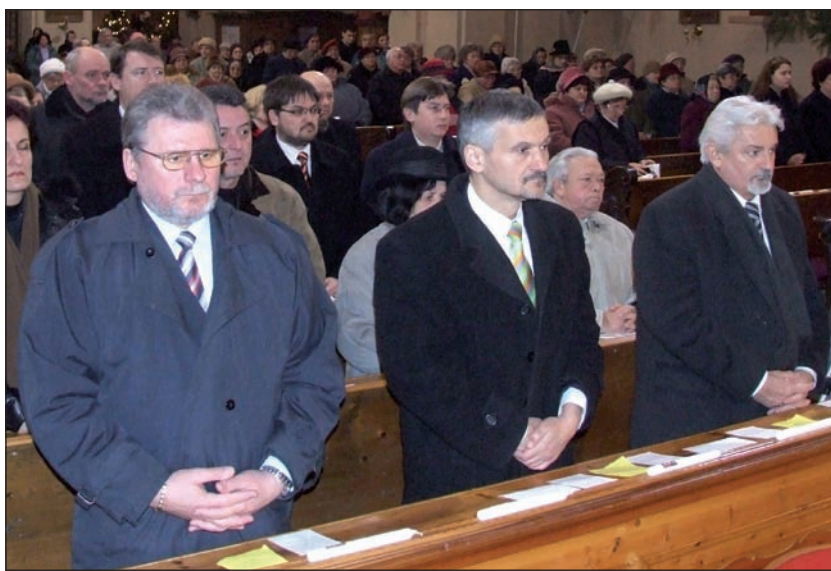
Ünnepi szentmisét tartottak február 2-án a Sarlós Boldogasszony templomban a városért. Az egyházi szertartáson Félegyháza elöljárói is részt vettek.