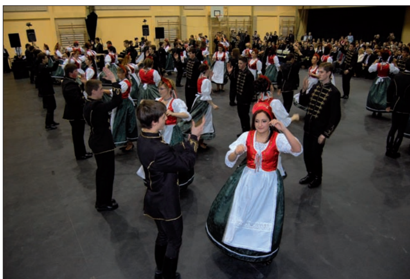
A Constantinum Intézmény végzős diákjainak szalagozó bálját tartották szombaton az iskola újonnan átadott sportcentrumában. A hagyományoknak megfelelően a nyitótánc ez alkalommal is a palotás volt.