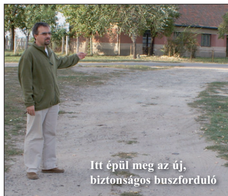
Itt épül meg az új, biztonságos buszforduló

A teljes beruházás 110 millió forintba kerül, ebből az önkormányzat költségvetését tizenegymillió terheli, a többit az európai uniós finanszírozású pályázati forrás állja.