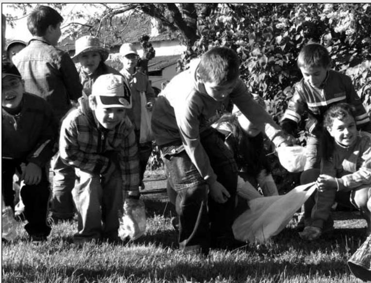
Nagyszabású szemétyűjtési akció zajlott városunkban a Föld Napján. A város valamennyi iskolája bekapcsolódott a programba. Képünkön a Dózsa iskolások egyik "brigádja" látható