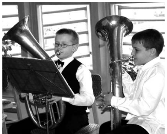
Tavaszköszöntő hangversenyt tartott a minap a Kiskun Művészeti Iskola a Petőfi Sándor Városi Könyvtárban. A koncerten a tanárok és diákok együtt léptek fel.

KAMATMENTESHITEL 1,5 MILLIÓ FORINT ÖSSZEGHATÁRIG MAXIMUM 18 HAVI TÖRLESTÉSSSEL! Pályázhatnak egyéni vagy társasvállalkozások, mezőgazdasági őstermelők. A pályázat benyújtásának határideje 2008. június 01. Részletes pályázati kiírás és nyomtatvány a Polgármesteri Hivatal Ügyfélszolgálati Irodájában és a Vagyonhasznosítási Csoportnál vehető át. Kiskunfélegyházi Vállalkozókat Támogató Közalapítvány. 6100, Kiskunfélegyháza, Kossuth u. 1.